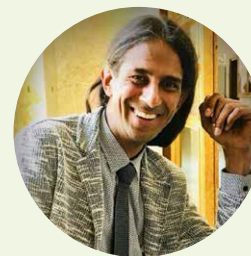
Avvocato Stabilito Abogado Dott. Sebastian Ochsenreiter

Cannabis Social Club Bolzano 39100 Bolzano - via Dante, 2 CF 94129910215 Tel +39 0471 1817167 info@cannabissocial.eu www.cannabissocial.eu